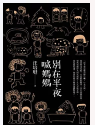
《別在半夜喊媽媽》 (愛孩子愛自己)