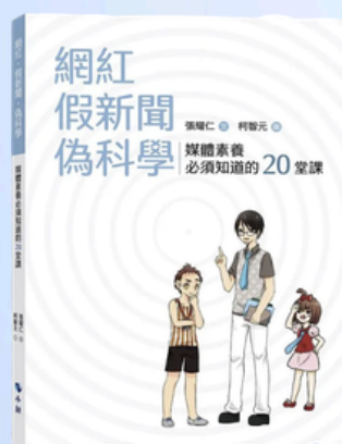
《網紅，假新聞，偽科學》 (小鯨生活文創)