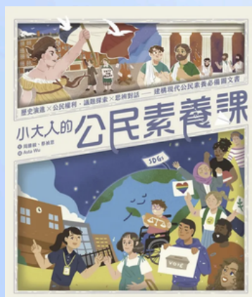
《小大人的公民素養課》 (親子天下)