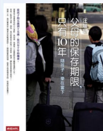
《父母的保存期限，只有10年》 (時報出版)