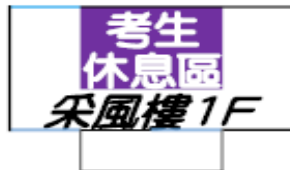
機子大樓 (37-42 試場)